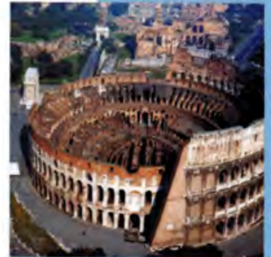
Roma - Colosseo

Entertainment, bars, cafeteria, pizzeria, kids playground, toilets, table tennis, internet point.