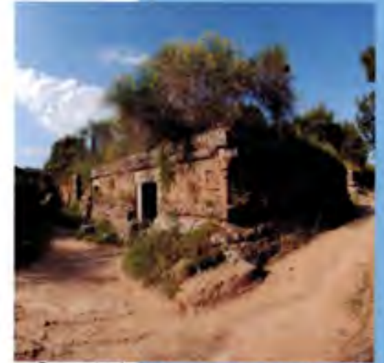
Cerveteri - Necropoli etrusca

Entertainment, bars, cafeteria, pizzeria, kinderspielplatz, toiletten, tischtennis, internet.