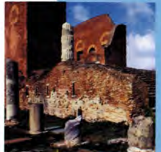
Roma - Ostia Antica

Animation, bars, café, pizzeria, parc de jeux pour enfants, toilettes, tennis de table, internet point.